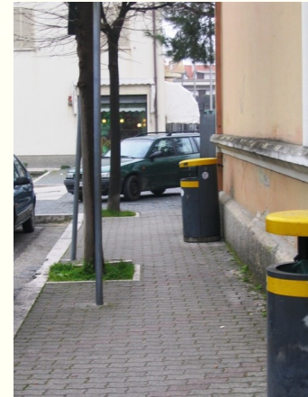
Angolo piazza Cavour - via Liguria: classico parcheggio selvaggio che occlude il marciapiede

possibile creare le condizioni per favorire la piena integrazione sociale di coloro che hanno difficoltà motorie. Essi hanno bisogno di essere aiutati a sentirsi uguali agli altri nella quotidianità, un'esigenza che deve essere sentita dalle istituzioni e dai cittadini come prioritaria e come tale deve spingere a decisioni e a comportamenti che realizzino le condizioni di una perfetta parità tra i cittadini, che per la nostra Costituzione hanno lo stesso diritto alla mobilità. E ciascuno di noi rifletta su quell'elementare dovere di solidarietà che dovrebbe legare gli appartenenti ad una comunità.