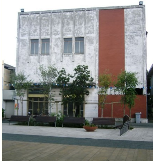
L'attuale edificio dell'ex “Cinema Ambra”