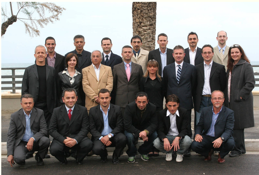
Città Attiva ... un anno fa

Proprio così, cari Amici, la nostra Associazione si appresta a spegnere la sua prima candolina! E lo fa con il vento decisamente in poppa! E' bello fermare il tempo dopo dodici lune vissute con debordante intensità; è fantastico ricordare, a chi è convinto del contrario, che la carriera politica non è e non sarà mai il motore della nostra azione; è sublime evidenziare come essere riusciti a rigenerare l'idea di politica come servizio partendo da una semplice spinta associativa, rappresenti, di fatto, il successo più significativo della nostra iniziativa. Non è un caso che l'esperienza che ha portato alla nascita di Città Attiva si accinga ad essere replicato in altre importanti municipalità omogenee al nostro territorio. E tuttavia il nostro buon senso ed il nostro sano realismo, ben lontani dall'appropriarsi di triti slogan d'oltreoceano, muovono le nostre coscienze anche in direzione di un'analisi critica, che ci induce a ricordare come spesso si è lavorato "per Voi" e non "con Voi".