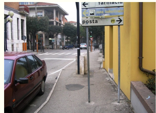
Incrocio via Roma-via A.Moro: gimkana proibitiva per diversamente abili