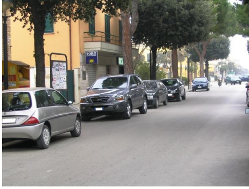
ore 11 di una domenica: parcheggi in via Colombo sul lato vietato per colazioni al bar o acquisti di altro genere

Abbiamo già avuto modo di denunciare quale sia l'entità del problema della pubblica sicurezza a Martinsicuro e certamente quella stradale è da annoverare tra le più precarie ed oserei aggiungere più in via di estinzione!