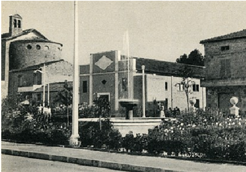
Il “Cinema Ambra” in una vecchia cartolina

In 30 (!) anni è possibile che NESSUN PARTITO POLITICO, NESSUN SINDACO, NESSUN ASSESSORE, abbia mai pensato che forse sarebbe stato utile per una cittadina con una notevole e galoppante espansione demografica, poter contare su una struttura (peraltro non necessariamente da ricostruire ex novo) già esistente, in un luogo (ripetiamo) strategico, da destinare a polo culturale della città stes-