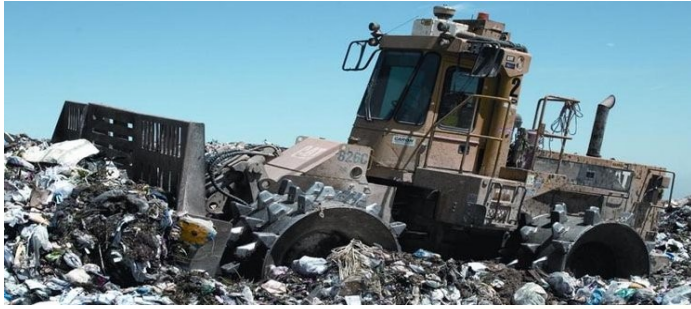
I costi di discarica sono notevolmente aumentati

La stangata è arrivata lo scorso mese di settembre ed ha colpito tutti, indistintamente. L'aumento della TARSU (Tassa Rifiuti Solidi Urbani) rispetto all'anno 2005 è pari a circa il 60%, ma se consideriamo anche gli aumenti degli anni precedenti arriviamo a percentuali da capogiro.