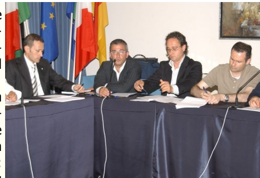
Il gruppo consiliare di Città Attiva

E ccoci a Voi, cari Concittadini. InformAttiva vede la luce dopo nove mesi esatti dalla costituzione dell'Associazione. Non è casuale l'analogia tra questo parto ed i primi vagiti di un bimbo.