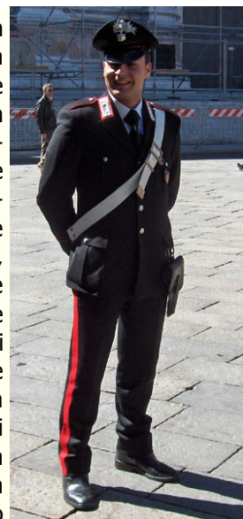
La presenza delle forze dell'ordine è diminuita negli anni

senza remore in Piazza Cavour o a pochi metri dalle nostre scuole! In questo periodo pre-natalizio, nel quale è doveroso scambiarsi auguri e fare buoni propositi, Città Attiva vuole promettervi che d'ora in poi l'impegno, e, se necessaria, la lotta per compiere passi decisivi verso una maggiore sicurezza pubblica, saranno operati con assoluta determinazione, a 360 gradi. Inoltre auguriamo a voi tutti ed a noi stessi che nel 2008 non ci si limiti ad avere qualche agente di polizia municipale in più nel solo periodo estivo, ma che l'Amministrazione comunale tutta possa affrontare con decisione il problema della sicurezza, questo prezioso ingrediente della qualità delle nostre vite, che merita la massima attenzione e che va coraggiosamente cercato in ogni possibile ambito (stradale, lavorativo, fiscale, etc.), senza esitazioni e lontano da confortevoli poltrone!